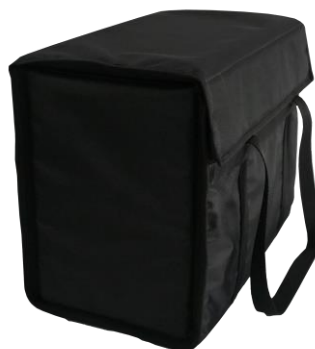
Bolsa de transporte