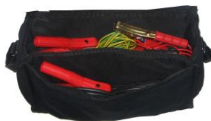
Bolso para cables