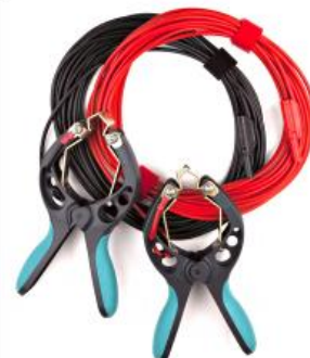
Cables de Voltage Sense (detección de tensión) con abrazaderas TTA