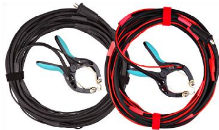
Cables de corriente y de detección con abrazaderas TTA

Todas las especificaciones aquí son válidas a temperatura ambiente de + 25 °C y con los accesorios estándar. Las especificaciones están sujetas a cambios sin previo aviso. Las especificaciones son válidas si el instrumento se utiliza con el conjunto de accesorios estándar.