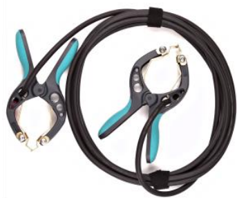
Cable de conexión de corriente con abrazaderas TTA