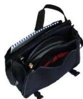
Bolsa del cable