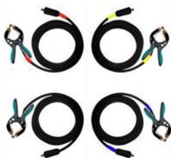
Conjunto de 4 cables de corriente con abrazaderas TTA

Todas las especificaciones aquí son válidas a temperatura ambiental de +25 °C con los accesorios estándar. Las especificaciones están sujetas a cambios sin previo aviso.