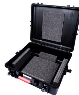
Caja de transporte de plástico – tamaño medio