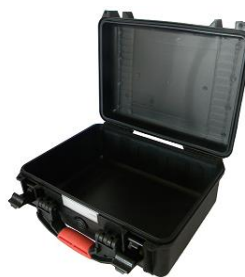
Caja de plástico del cable